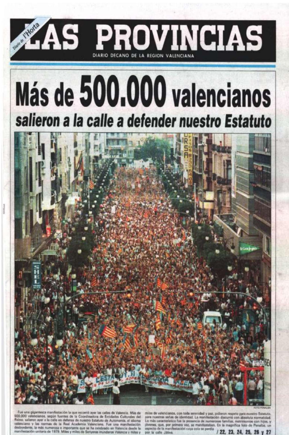
Imagen 1: Portada del Diario Las Provincias del 14 de junio de 1997, con el titular “Más de 500.000 valencianos salieron a la calle a defender nuestro Estatuto”.